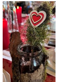
Das Geschenk zum Muttertag.

Nach dem ganzen Entspannen und Verwöhnen haben sich die Kinder noch etwas ganz Witziges ausgedacht. Jede Mutter musste bei dem Spiel „Pie Face“ mitmachen und bekam leider eine kleine Ladung Sahne ab. Nachdem jeder dieses Spiel gemeistert hat, durfte jedes Kind seine Mama in die „Knutschkammer“ entführen und dort ihnen ein selbstgebasteltes