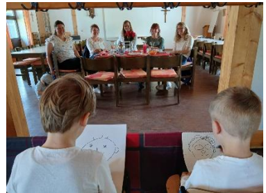
Die Kinder malen für die Mütter ein Portrait.

Snacks bereitgestanden. Es folgte ein buntes Programm was die Kindergottesdienstkinder schon wochenlang extra für diesen Tag einstudiert hatten. Ein Kind betete zu Beginn ein selbstgeschriebenes Gebet. Danach sangen sie ein Lied und spielten mehrere „Cartoons“ wie zum Beispiel „Meine Mutter ist so cool...“. Jedes Kind hatte sich einen eigenen Satz aussuchen können, warum ihre Mutter die Coolste ist. Es wurden besinnliche und lustige Geschichten vorgelesen und von den Kindern