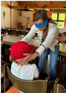
Jede Mutter musste blind ihr eigenes Kind erkennen.

Empfangen wurden sie von den Kindern in einem schönen Outfit mit einer selbstgebastelten Fliege im Spalier. Dort wartete schon ein leckeres Glas alkoholfreier Sekt, danach wurden sie zu Tisch geführt. Kaffee und Muffins waren als leckere